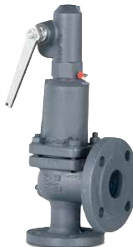
Höglyftande säkerhetsventil VYC 496