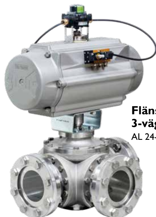
Flänsade 2- och 3-vägs kulventiler AL 24-PZ - AL 39-PZ