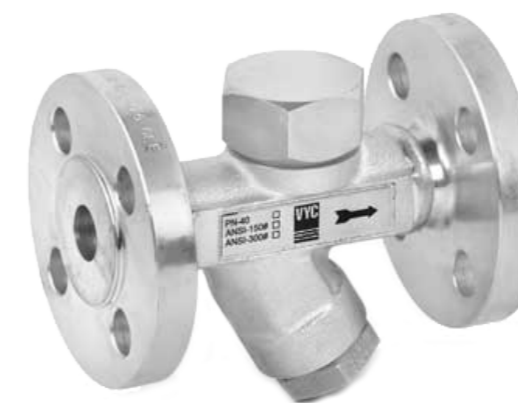
Utblåsningsventil för avluftning av smutsig ånga och slam VYC 460