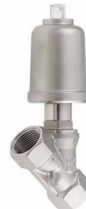
Snedsättesventil med pneumatiskt manöverdon SCHUBERT & SALZER 7010