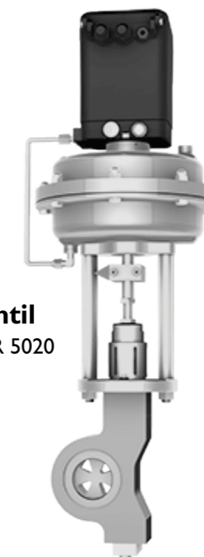
Segmentdiskventil SCHUBERT & SALZER 5020